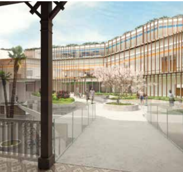
Centro comunitario y de salud Matta Sur (Santiago, Chile).