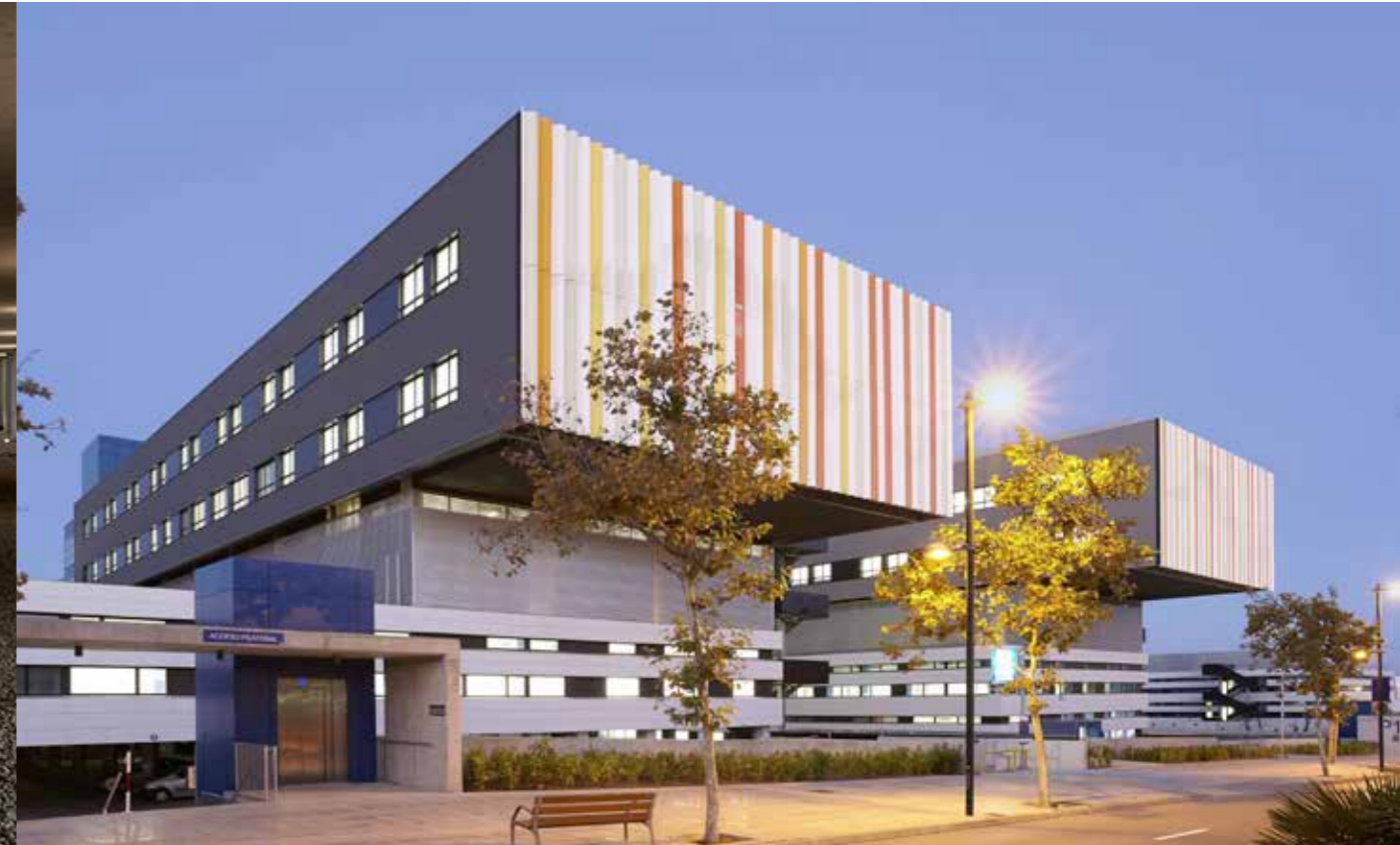
Hospital Can Misses (Ibiza, España).