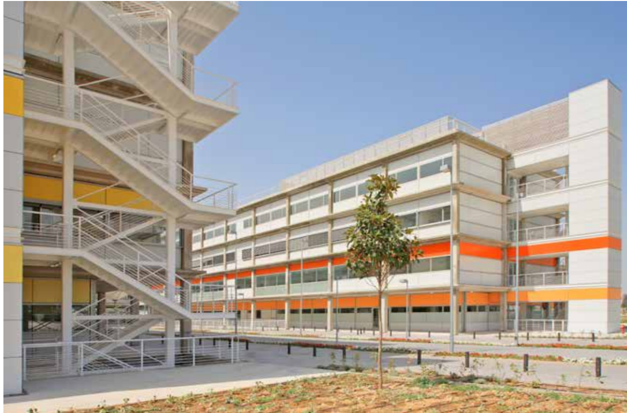
Hospital Infanta Leonor (Madrid, España).

Más recientemente, entre otros proyectos, ha participado en colaboración con Swarq en los anteproyectos referenciales de los hospitales de Quillota y Marga Marga, por los que Luis Vidal + arquitectos ha recibido del Ministerio de Obras Públicas (MOP) la máxima calificación y el reconocimiento como la mejor consultoría "MOP Concesiones" por el gobierno chileno; el Servicio de Geriatria y Salud Mental - Hospital Clínico de Magallanes y un centro de Salud sin precedentes por combinar áreas de cultura y enseñanza, con servicios clínicos: el Centro de Salud Matta Sur, en Santiago de Chile.