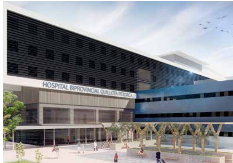
Hospital Biprovincial Quillota Petorca (Valparaíso-Chile).