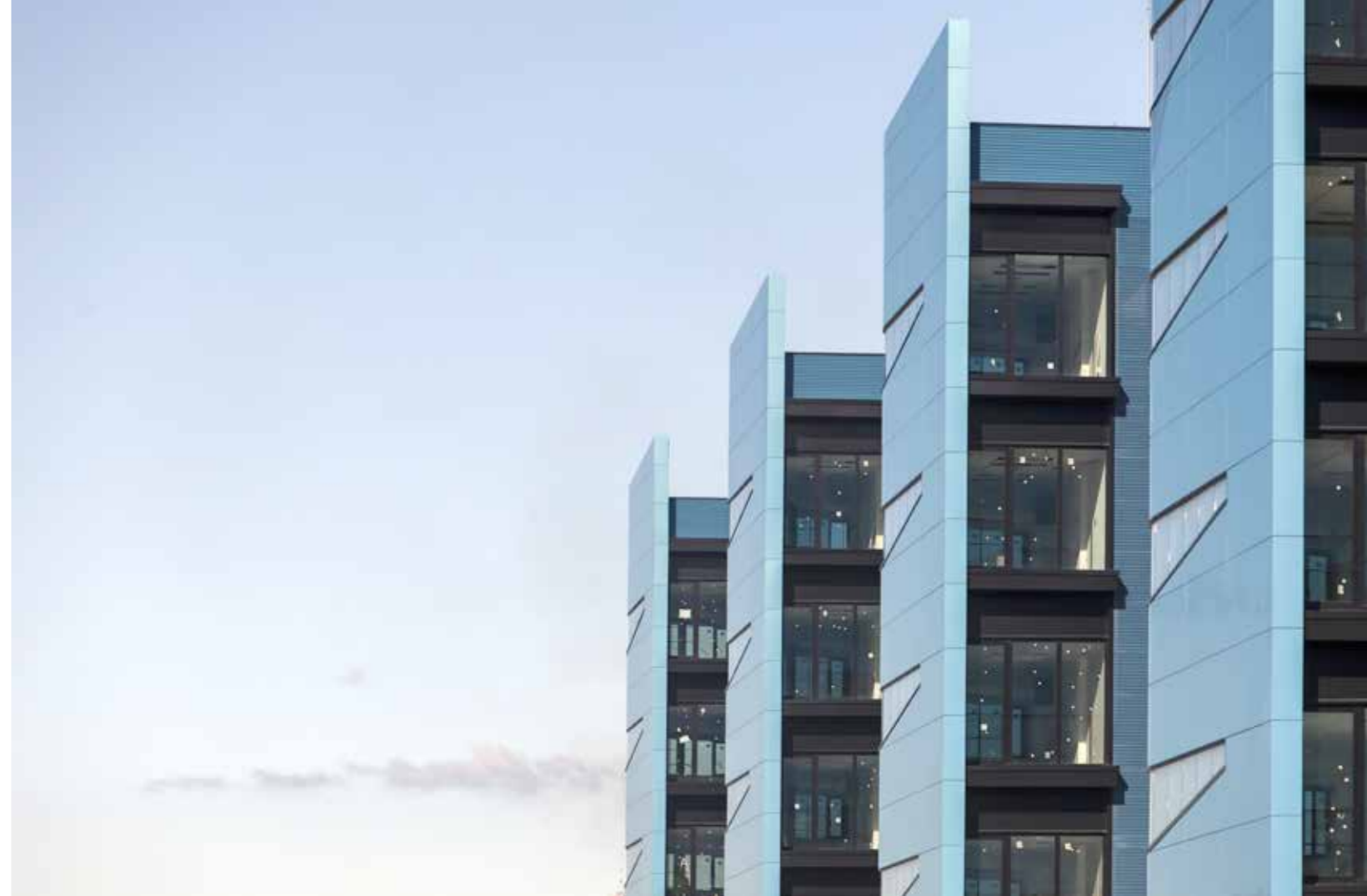
Hospital Álvaro Quunqueiro (Vigo, España).

La investigación forma siempre parte fundamental del método de trabajo. Se equilibra de este modo el presente con el futuro, manteniendo así una imagen tecnológica en todos los diseños. Finalmente, el enfoque es siempre colaborativo y no solo creen en el trabajo en equipo, sino que se hace de ello la principal herramienta de resolución de problemas. El diseño final siempre se basa en el concepto desarrollado inicialmente y al diseño adaptado a presupuesto (design to budget).