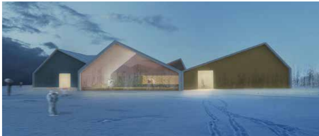
Servicio de Geriatria y Salud Mental - Hospital Clínico de Magallanes (Punta Arenas, Chile).