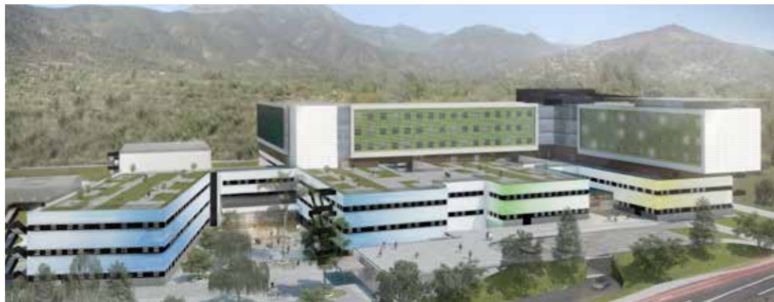
Hospital Provincial Marga Marga (Valparaíso, Chile).