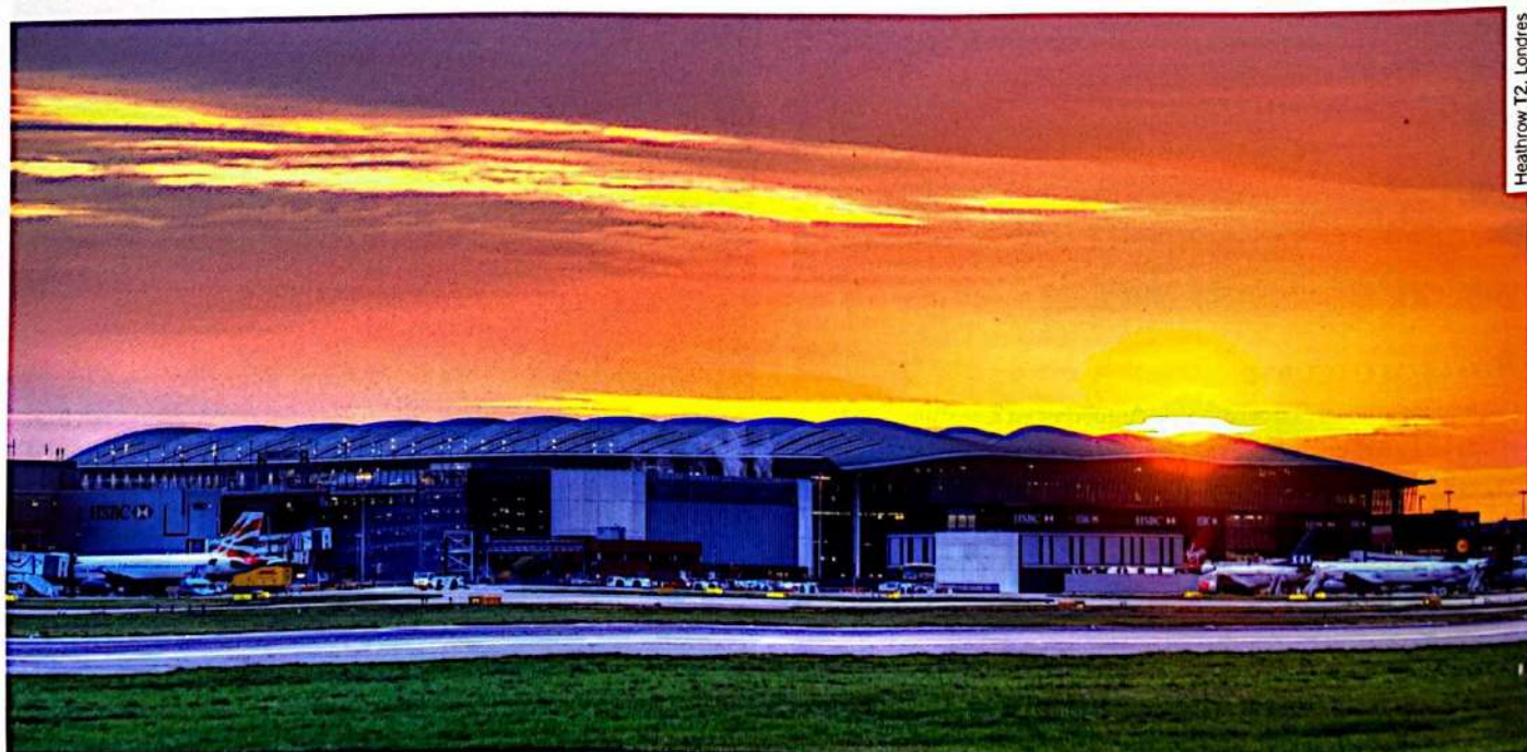
Heathrow T2, Londres

• Oficinas: Torres Colón, Madrid | Parque Empresarial en Julián Camarillo, Madrid | • Urbanismo: P.E.T.O.T. Samaná (República Dominicana) | Jardín Botánico El Chagual, Chile | • Usos Mixtos: Patio Kennedy, República Dominicana | • Hospitalario: Hospitales de la Red Maule, Chile | • Aeroportuario: Aeropuerto Internacional del Cibao, República Dominicana | Expansión de la Terminal E del Aeropuerto Internacional Boston Logan, EEUU | Aeropuerto Internacional Pittsburgh, EEUU.