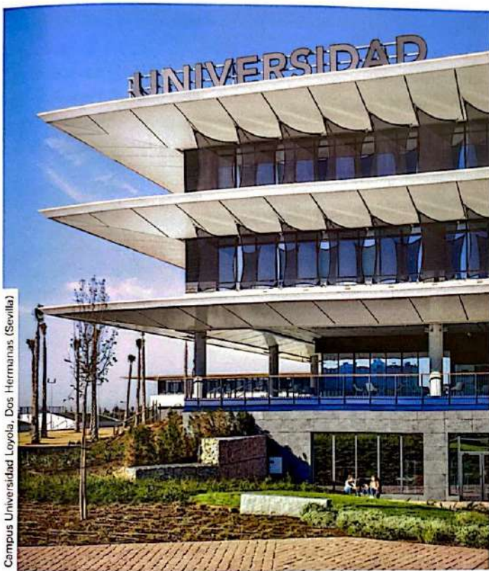
Campus Universidad Loyola, Dos Hermanas (Sevilla)