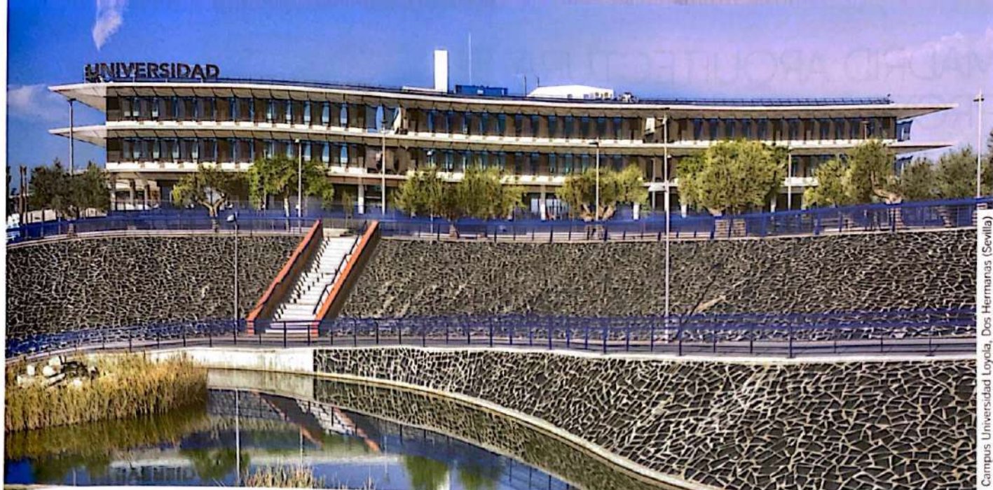
Campus Universidad Loyola, Dos Hermanas (Sevilla)