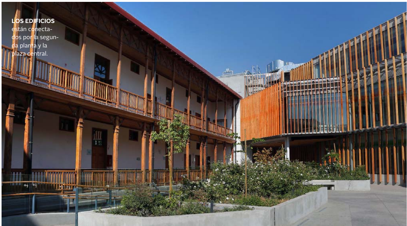
LOS EDIFICIOS están conecta- dos por la segun- da planta y la plaza central.