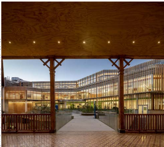
© ARYEH KORNFIELD / GENTILEZA LUIS VIDAL + ARQUITECTOS